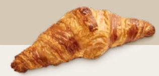
67420 Croissant Margarina Selección D'Or