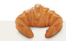
61690 Croissant Mantequilla Listo

Hornea el Croissant París Curvo y córtalo cuidadosamente por la mitad. Prepara nata montada. Corta unas lunas de mango Con la ayuda de una manga pastelera, moldea la base del Croissant con la nata montada. Añade las lunas de mango y unas frambuesas. Acáballo con unas hojitas de menta.