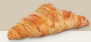
69211 Croissant París Premium 69212 Croissant París Premium (125 u)

El Tzatziki es una salsa de origen griego muy completa ya que se puede utilizar como acompañamiento de carnes, como untado en panes y como salsa en recetas. Mezclamos yogur griego natural, añadimos pepino rallado y escurrido, pimienta, medio diente de ajo triturado, eneldo, zumo de lima y aceite de oliva.