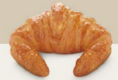
61690 Croissant Mantequilla Listo