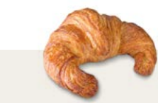
67450 Croissant París Curvo