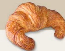
67450 Croissant París Curvo