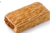
64490 Mixto de Hojaldre