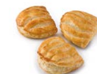
61410 Mini Luna Pizza