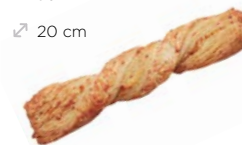
63970 Börek de Queso