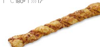
67981 Twister a la Mostaza