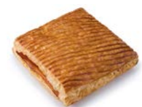
68640 Rayati de Pavo al Camembert