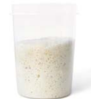
Contiene masa madre

Rebanadas, bocadillos mini, bocadillos maxi, pinchos, tapas, pan de mesa.