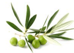
Con aceite de oliva