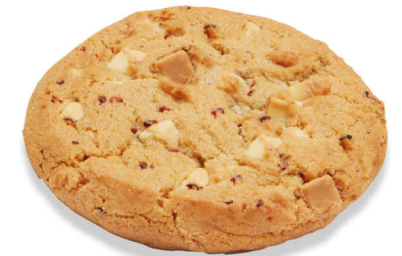
60253 Cookie Fully Baked White Chocolate Raspberry ● 34 u / 76 g / 13x13 30-35' Desc. / 10,5 cm Elaborado con Mantequilla Descongelar y listo