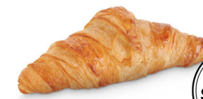
89234 Croissant París Fácil ●● 125 u / 60 g / 8x5 / 20-30' Desc. 160-180° / 15-18' Horno / 14,5 cm Clean Label / Vegetariano 100% Natural / Elaborado con Mantequilla (20%) Sin Conservantes / RSPO