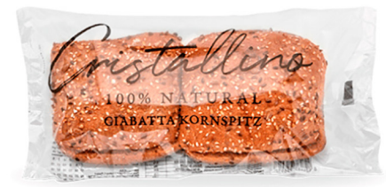
60036 Ciabatta Cristallino Kornspitz • (Precortada) 28 u / 93 g / 4x14 / 20-30' Desc. / 11,5 cm Clean Label / Vegano / Vegetariano / 100% Natural / Aceite de oliva / Descongelar y listo

● Disponibilidad inmediata para CDMX ● Disponibilidad inmediata para Cancún ● Disponibilidad inmediata para los Cabos ● Disponibilidad inmediata para Guadalajara ● Disponibilidad inmediata para Monterrey