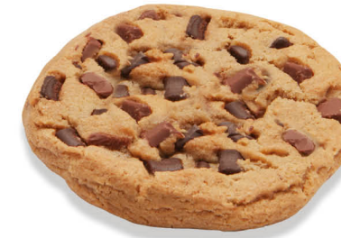
60252 Cookie Fully Baked Double Chocolate ●● 34 u / 76 g / 13x13 30-35' Desc. / 10,5 cm Elaborado con Mantequilla Descongelar y listo