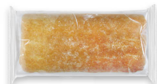
10154 Chapata ● 55x2 u / 240 g / 5x7 / 10-15' Desc. / 19,5 cm Larga Vida / Descongelar y listo