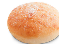
69837 Burger Cristallino • (Precortado) 60 u / 75 g / 4x8 / 20-30' Desc. / 11,4 cm Clean Label / Contiene Masa Madre / Vegano / Vegetariano / 100% Natural / Descongelar y listo