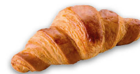
40211 Croissant Margarina Gigante ● 116 u / 88 g / 8x9 / 20-30' Desc. / 90-120' Ferm. / 180-190° / 12-15' Horno / 14 cm Vegetariano Elaborado con Margarina Sin Conservantes