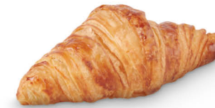
61790 Croissant París listo ● 30 u / 52 g / 8x9 20-30' Desc. / 19,5 cm Clean Label / Vegetariano / 100% Natural Elaborado con Mantequilla Sin Conservantes / Descongelar y Listo

Croissants irresistibles y sorprendentes, siempre