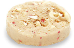
60257 Cookie Puck White Choc Raspberry ● 90 u / 80 g / 8x12 / 150-155° 9-11' Horno / 4 cm Elaborado con Mantequilla