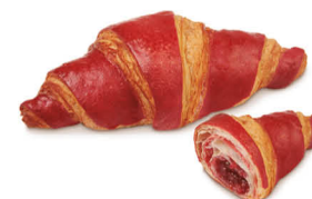
60155 Croissant Bicolor Frambuesa ● 36 u / 90 g / 8x12 / 20-30' Desc. 165-170° / 17-22' Horno / 17 cm Elaborado con Mantequilla / Halal