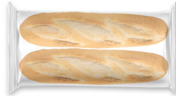
10163 Media Baguette ● 30x2 u / 262 g / 5x7 / 10-15' Desc. / 25 cm Larga Vida / Descongelar y listo