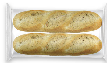
10161 Media Baguette Pesto ● 30x2 u / 260 g / 5x7 / 10-15' Desc. / 25 cm Larga Vida / Descongelar y listo