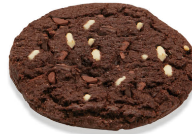
60251 Cookie Fully Baked Triple Chocolate ● 34 u / 76 g / 13x13 30-35' Desc. / 10,5 cm Elaborado con Mantequilla Descongelar y listo