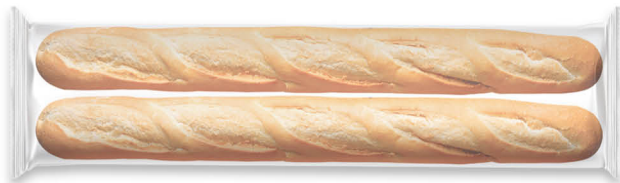
10162 Baguette Francesa ● 15x2 u / 540 g / 5x7 / 10-15' Desc. / 55 cm Larga Vida / Descongelar y listo