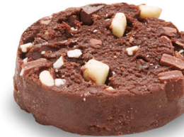
60254 Cookie Puck Triple Choc ● 90 u / 80 g / 8x12 / 150-155° 9-11' Horno / 4 cm Elaborado con Mantequilla