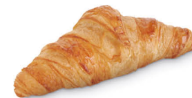
89233 Croissant Sophie Crudo ● 160 u / 60 g / 8x9 / 20-30' Desc. 120' Ferm. / 180° / 16' Horno / 14,5 cm Elaborado con Mantequilla (28%)