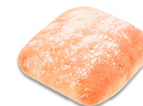
69444 Ciabatta Cristallino • (Precortada) 48 u / 95 g / 4x8 / 20-30' Desc. / 12,5 cm Clean Label / Contiene Masa Madre / Vegano / Vegetariano / 100% Natural / Aceite de oliva / Descongelar y listo