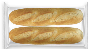
10160 Media Baguette Cebolla ● 30x2 u / 260 g / 5x7 / 10-15' Desc. / 25 cm Larga Vida / Descongelar y listo