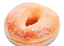
60875 Bagel Cristallino • (Precortado) 60 u / 55 g / 4x8 / 20-25' Desc. / 11,4 cm Clean Label / Contiene Masa Madre / Vegano / Vegetariano / 100% Natural / Aceite de oliva / Descongelar y listo