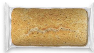
10159 Chapata Multigrano ● 55x2 u / 240 g / 5x7 / 10-15' Desc. / 19,5 cm Larga Vida / Descongelar y listo