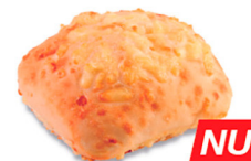
69719 Ciabatta Cristallino Gouda • 64 u / 95 g / 4x8 / 20-25' Desc. / 11 cm Contiene Masa Madre / Aceite de oliva / Descongelar y listo