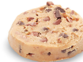
60256 Cookie Puck Double Choc ● 90 u / 80 g / 8x12 / 150-155° 9-11' Horno / 4 cm Elaborado con Mantequilla