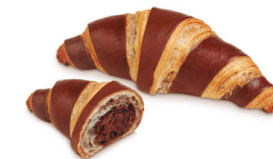
60165 Croissant Bicolor Cacao ● 36 u / 90 g / 8x12 / 20-30' Desc. 165-170° / 17-22' Horno / 17 cm Vegetariano / Elaborado con Mantequilla Sin Aromas Artificiales / Halal