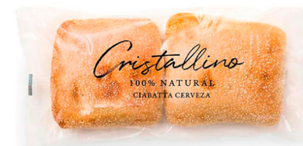
60032 Ciabatta Cristallino • Cerveza (Precortada) 28 u / 98 g / 4x14 / 40-50' Desc. / 11,5 cm Clean Label / Contiene Masa Madre / Vegano / Vegetariano / 100% Natural / Aceite de oliva / Descongelar y listo