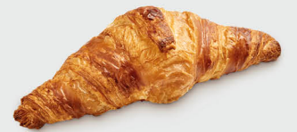
87423 Croissant Selección D'Or ●● 64 u / 75 g / 10x8 / 20-30' Desc. 165-175° / 17-19' Horno / 14,5 cm Vegetariano / Elaborado con Margarina Sin Conservantes