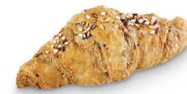
89220 Croissant Caprice Cereales ●● 55 u / 80 g / 10x9 / 20-30' Desc. 170-180° / 18-20' Horno / 14,5 cm Clean Label / Vegetariano 100% Natural / Elaborado con Mantequilla (22%) Sin Conservantes / RSPO